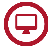
Blackline Live™ -verkkoportaali